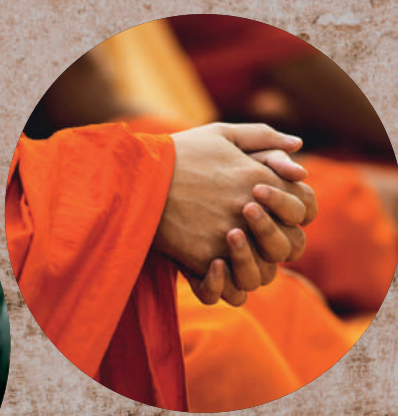
MYSTIK, KULTUR OG VISDOM