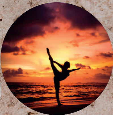
BALANCE, NATUR OG BEVIDSTHED