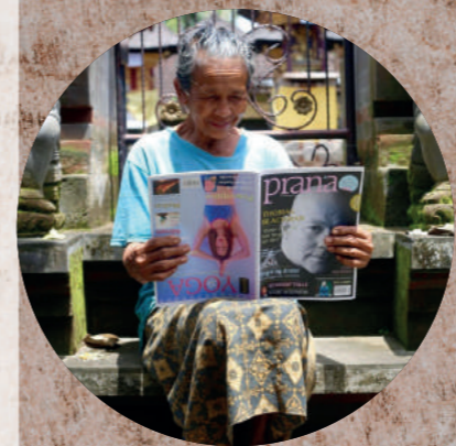
APPELLERER TIL ALLE UANSET KØN OG ALDER