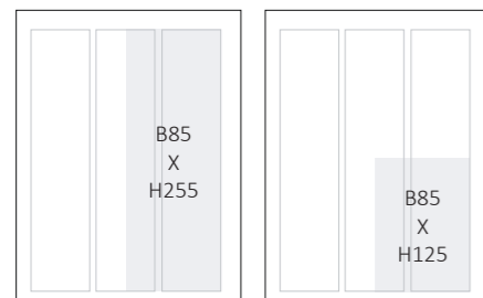
1/2 side højformat