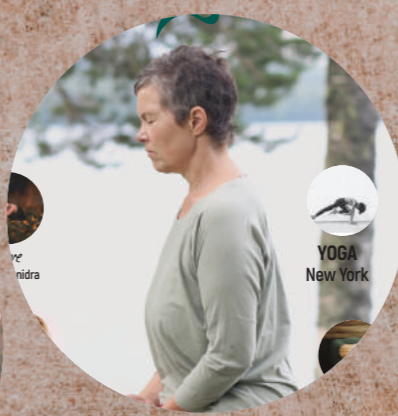
KROPPEN OG DENS INDRE VERDEN