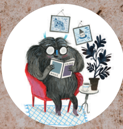
SAGLIGHED, FAGLIGHED OG HUMOR