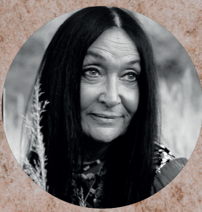
ÆRLIGHED OG KÆRLIGHED